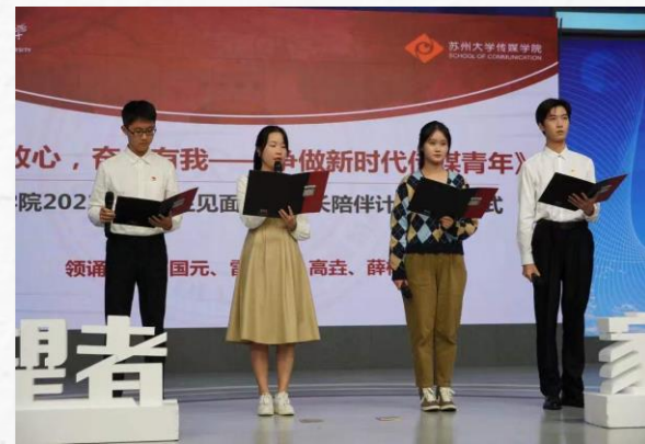
成长陪伴导生 领颂《请党放心，奋斗有我——争做新时代传媒青年》