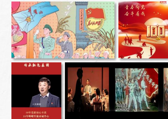
“青春向党 奋斗有我” 宣传品征集活动