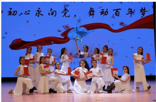
新生舞蹈团队 根据丁香事迹创作舞蹈《遇见》