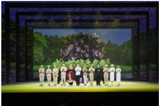
我院 21名 学生参演苏州大学原创话剧《丁香·丁香》