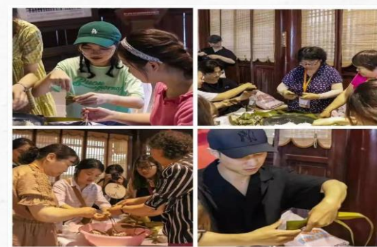
闻粽香，品吴韵 端午主题活动