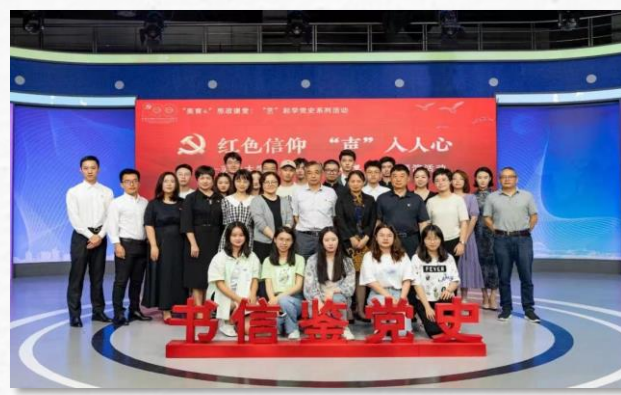
“书信鉴党史” 诵读活动