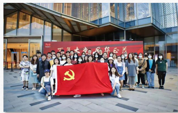
“百年大党 风华正茂” 音乐党课