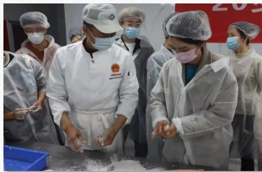
手作寻味冬至 20岁的苏大学子走进200岁的黄天源