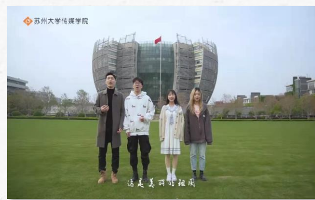
“青春向党，红歌传唱” 主题活动