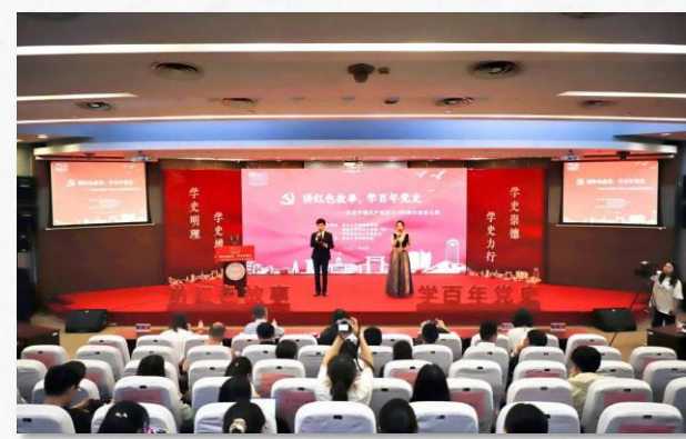
“讲红色故事，学百年党史” 演讲比赛