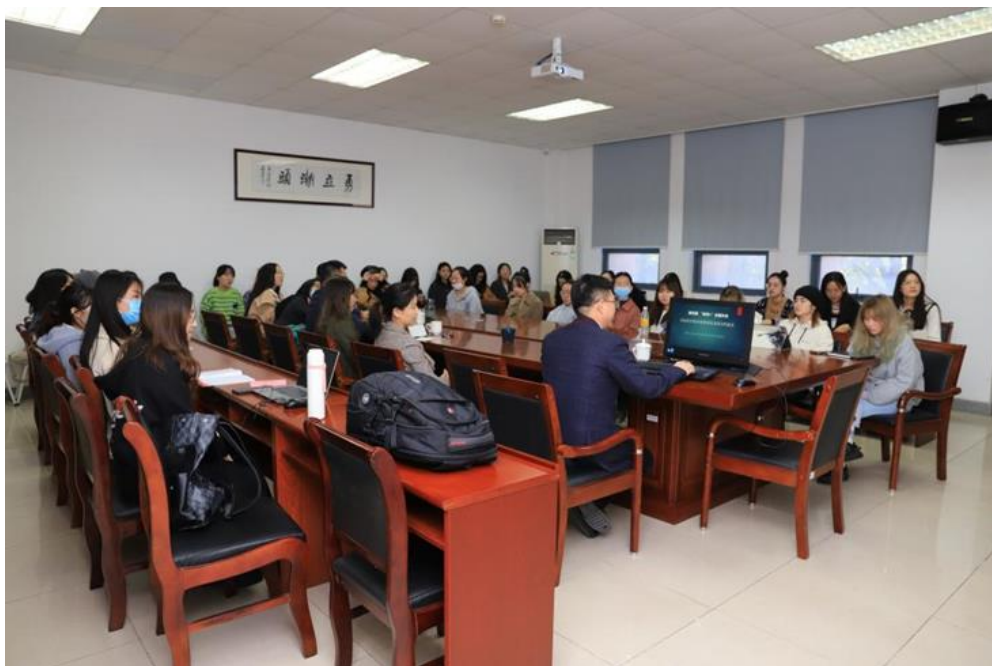
举办第五期“运河+”主题沙龙

学院主办了第五届国际大学生新媒体节和第四届国际传播高峰论坛，得到学术同行的高度评价，并扩大了学院影响力。学院与国际交流处合作，联合举办了“智能传播时代新闻传播教育国际论坛”。与中国传媒大学联合举办了“第十届新闻学于传播学博士生国际学术研讨会”，此类国际会议在学界和高校中已形成较强影响力和示范效应。