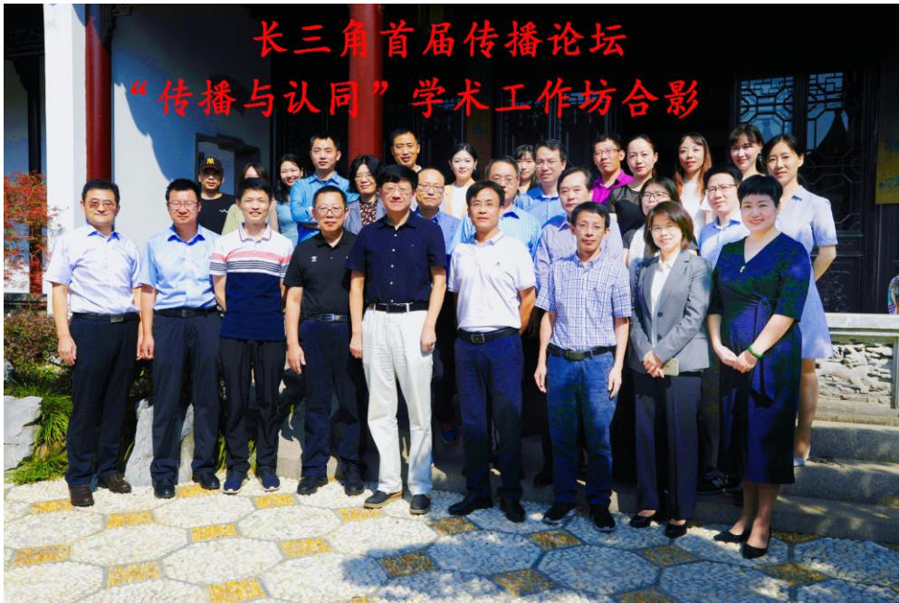
举办长三角首届传播论坛暨“传播与认同”学术工作坊