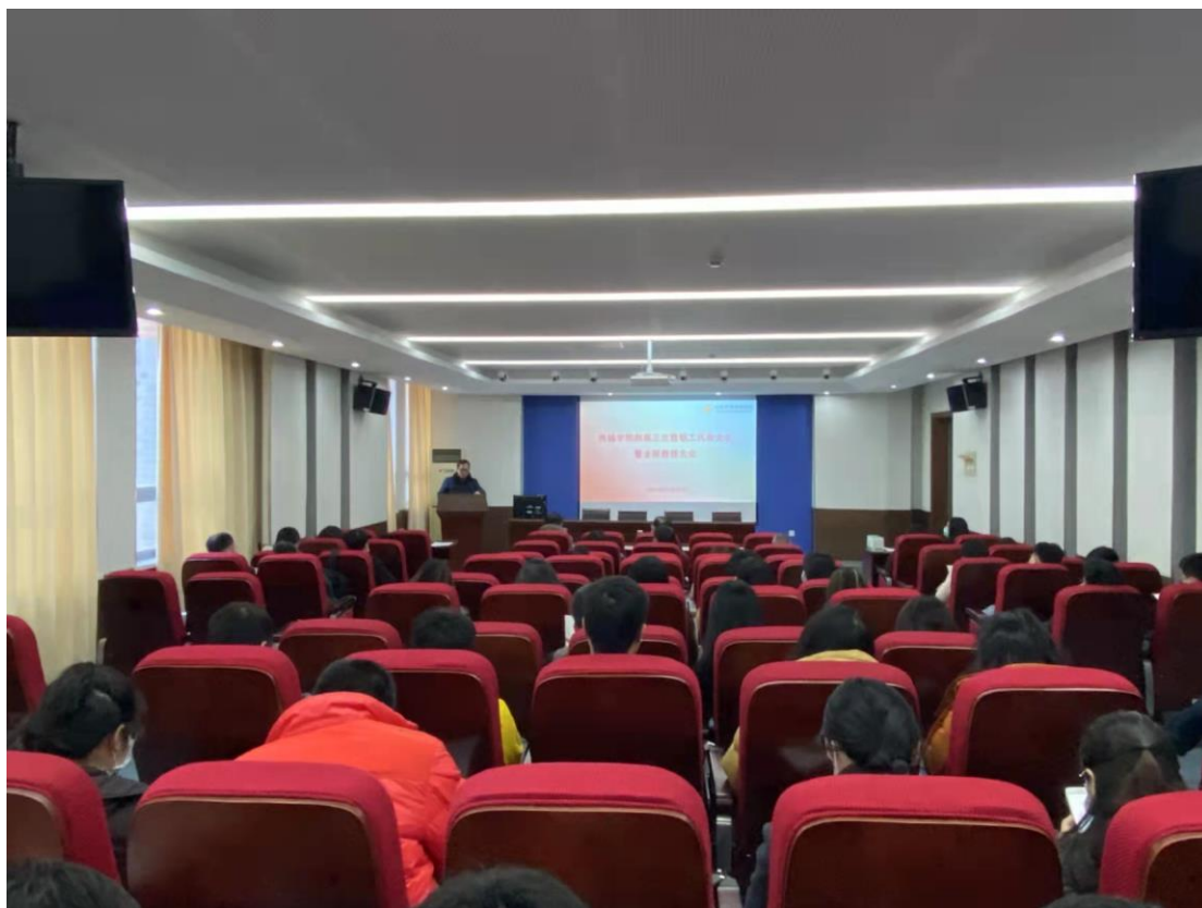
召开第二次全院教师大会暨政治学习