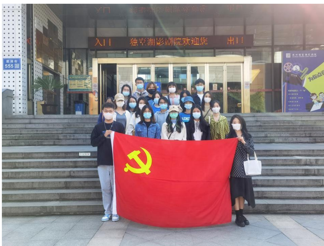
研究生党支部赴独墅湖影剧院观看“四史”教育电影

苏州大学传媒学院在 2021 年围绕学院特色和学生需求举办了各类校园文化活动，如第二届“春之影”摄影大赛、红色经典线上读书分享会、在苏州大学第十八届研究生学术科技文化节期间特别策划了摄影展与现场“拍立得”互动等。这些校园文化活动既有与学术密切相关的文化产品，也有校园高雅文化的代表，更有历史文化积淀的物质载体。