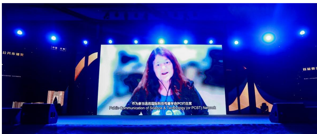
主办首届“赛先生”科学传播苏州论坛

学院主办了第五届国际大学生新媒体节和第四届国际传播高峰论坛，得到学术同行的高度评价，并扩大了学院影响力。学院与国际交流处合作，联合举办了“智能传播时代新闻传播教育国际论坛”。与中国传媒大学联合举办了“第十届新闻学于传播学博士生国际学术研讨会”，此类国际会议在学界和高校中已形成较强影响力和示范效应。