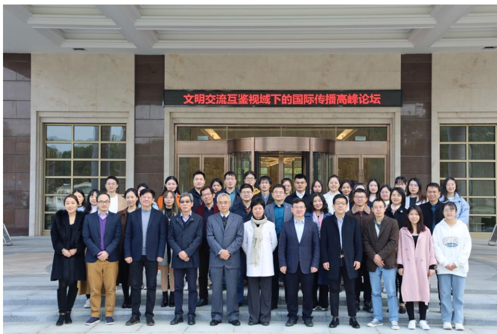
主办第四届国际传播高峰论坛