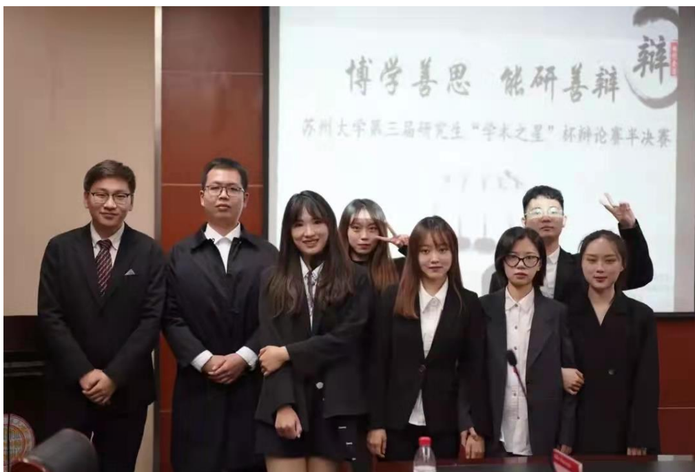
研究生参加“学术之星杯”辩论赛