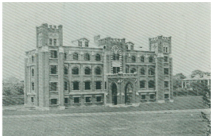
东吴大学第二座学舍——孙堂，1913年夏图书馆由林堂迁入此楼二楼北206室。