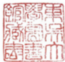
29×29mm 东吴大学图书馆藏书 (民国时期)