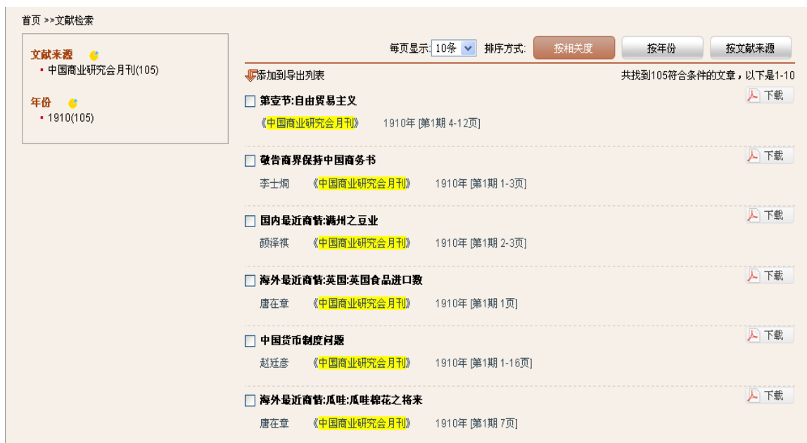
图 3-4：刊名的链接检索页

步骤4：二次检索 如果检索结果太多，可以对结果进行二次检索，二次检索功能包括三个：在结果中检索、在结果中添加、在结果中去除。例如：检索步骤1的检索结果中题名中含有“信义”的内容，选择题名输入“信义”，选中“在结果中检索”，点击“检索”执行结果（见图3-5）