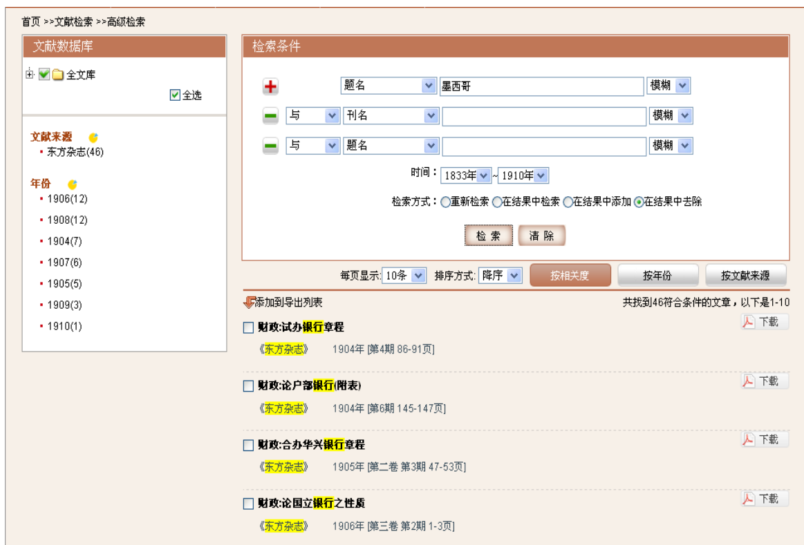
图3-8: “在结果中去除”页面