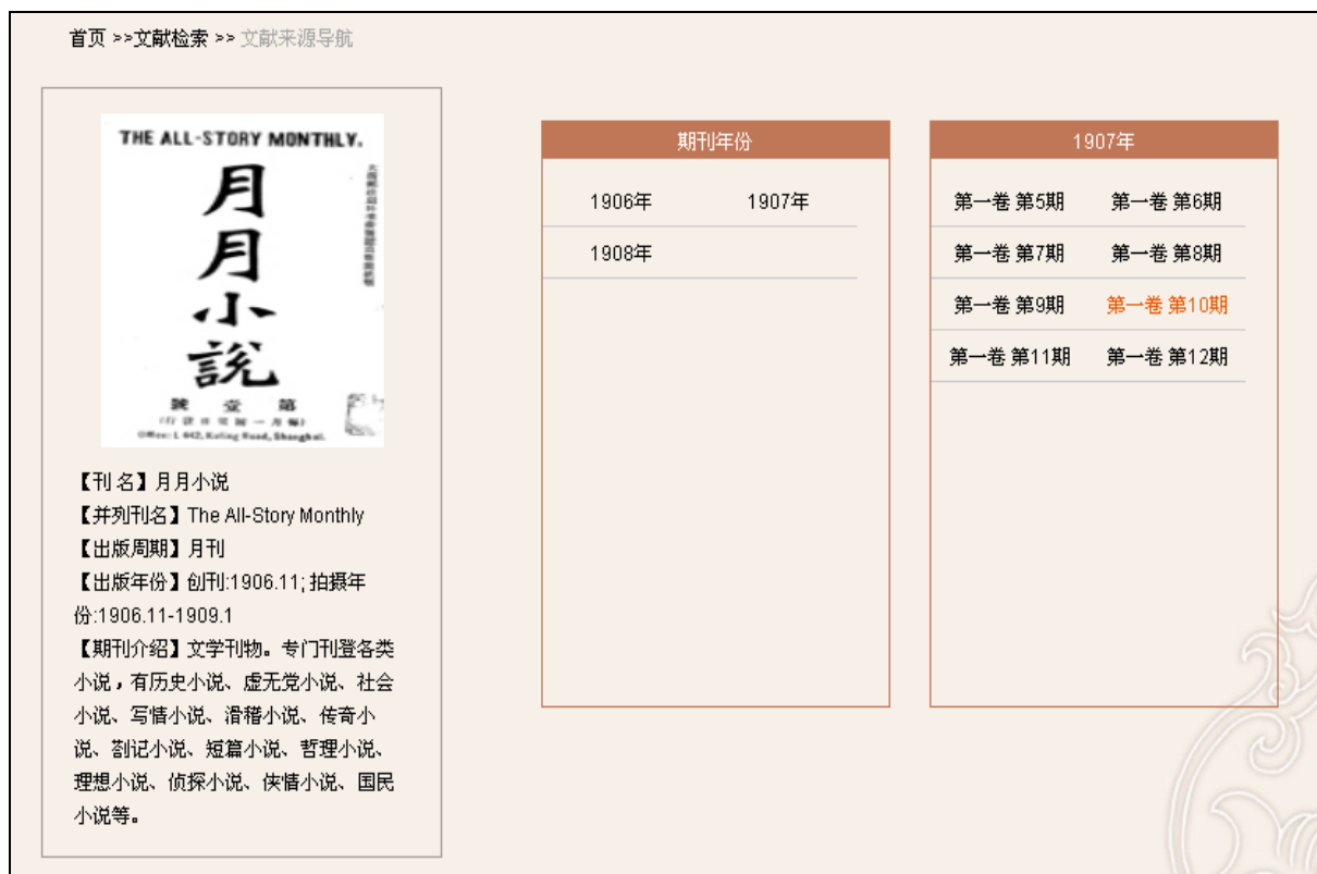
图3-18: "月月小说" 收录内容页面