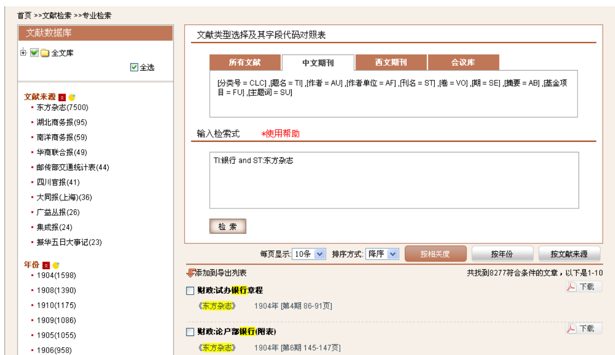
图3-10：输入检索表达式：TI:银行 and ST:东方杂志