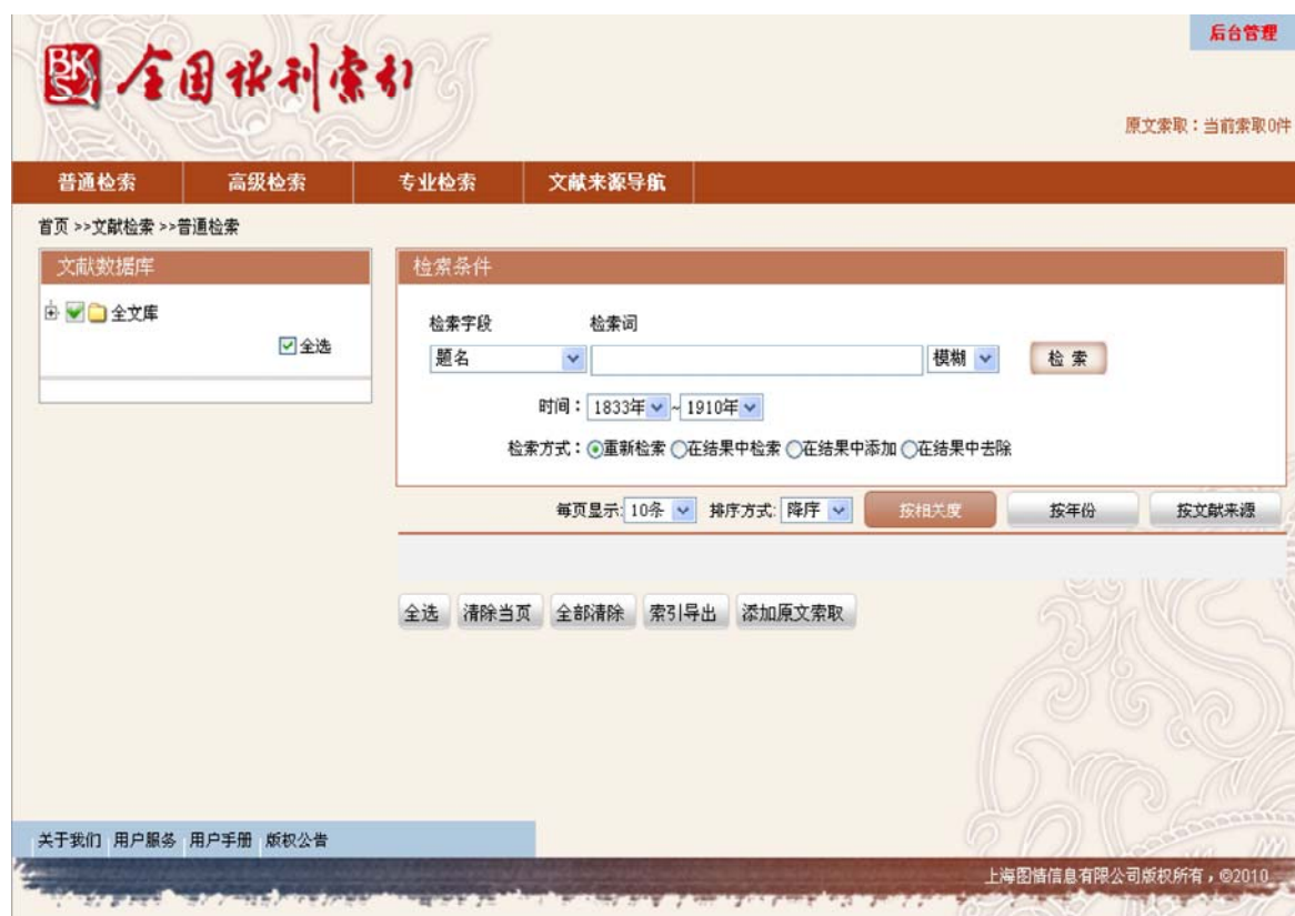
图2-1:数据库默认检索页面