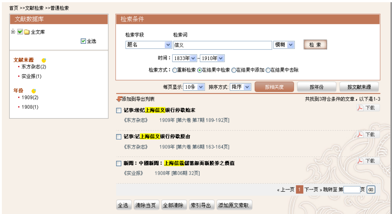
图3-15: 检索结果输出选择页面