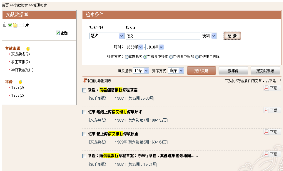
图 3-5：二次检索结果页

步骤4：二次检索 如果检索结果太多，可以对结果进行二次检索，二次检索功能包括三个：在结果中检索、在结果中添加、在结果中去除。例如：检索步骤1的检索结果中题名中含有“信义”的内容，选择题名输入“信义”，选中“在结果中检索”，点击“检索”执行结果（见图3-5）