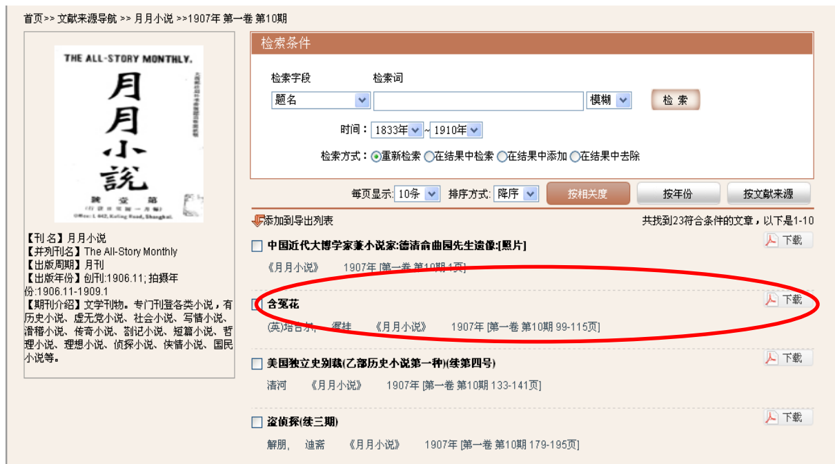
图3-19: 1907年第1卷第10期收录详细结果, 点击每条记录后的PDF标记可下载全文