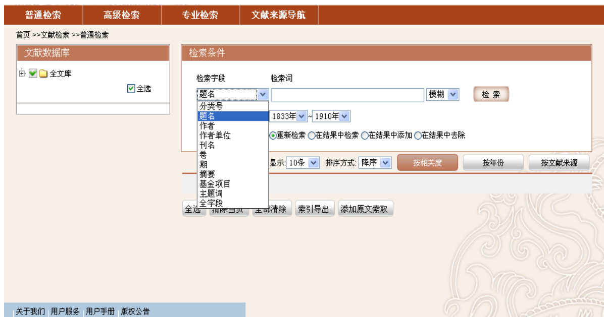
图3-1：字段检索的可检字段