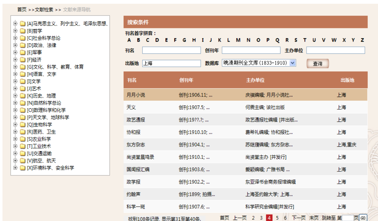
图3-17：晚清期刊全文库期刊导航