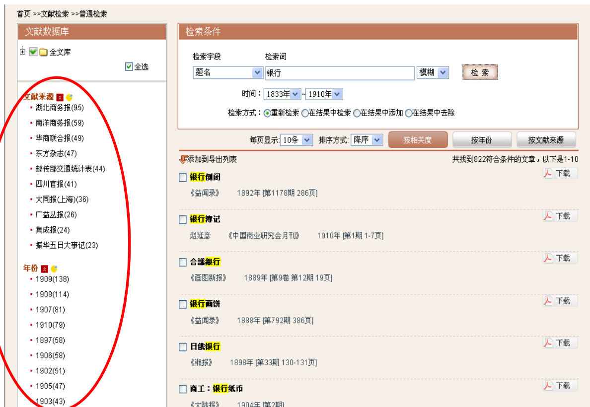
图3-16:检索结果页左侧的文献聚类结果，每项聚类可点击显示详细结果

(4)检索结果聚类功能：对每次检索结果按数据库、文献来源及年份进行聚类，可以对检索结果进行分析，了解文献的分布情况，提供研究参考见图3-16