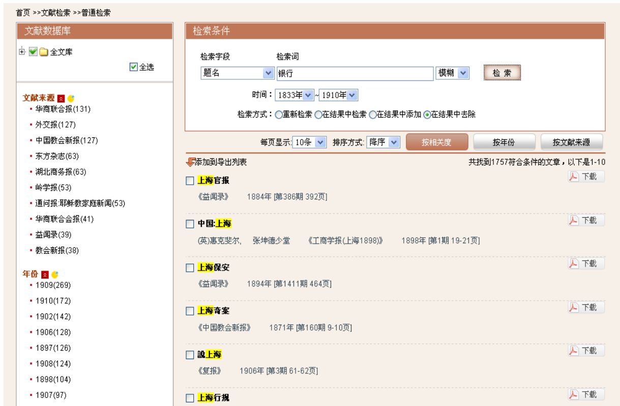
图3-14: 在结果中去掉页面