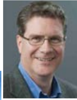
Professor of Haas Business School, UC.Berkeley. Earl F. Cheit Award for Excellence in Teaching of Haas Business School.