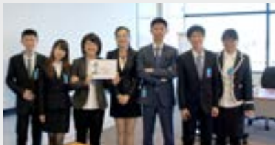
Time: 2013.1.28 Team: E-lining BP: Table Solution for Restaurants