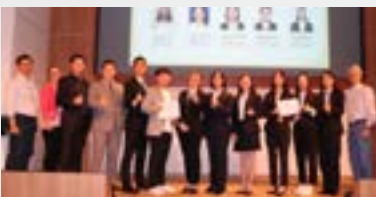
Time: 2019.8.8 Team: Go kapital BP: Student2student