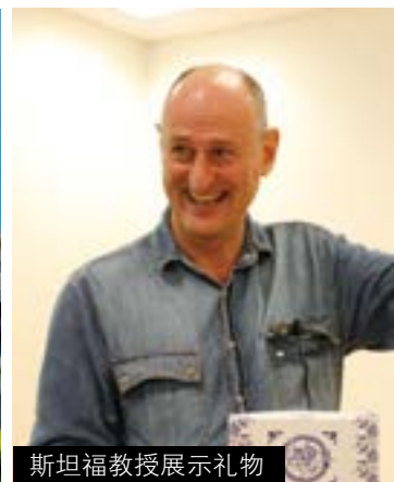
斯坦福教授展示礼物