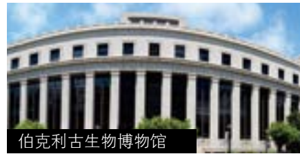
伯克利古生物博物馆