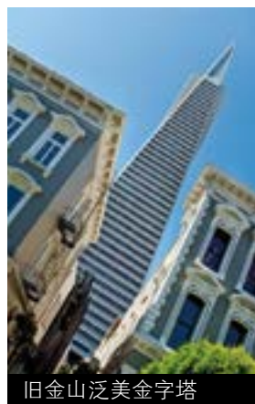
旧金山泛美金字塔