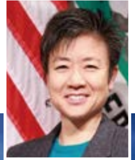
UC.Berkeley Industry fellow, Center for Entrepreneurship and Technology, College of Engineering.