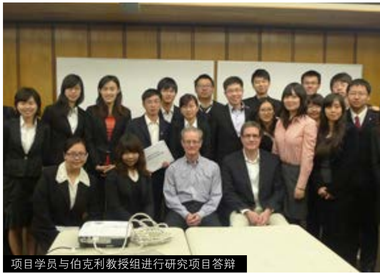
项目学员与伯克利教授组进行研究项目答辩