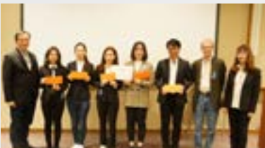
2018.1.27 Team: TOP Team BP: Heat-up