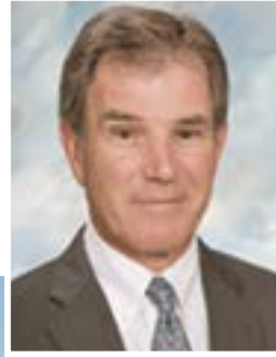
Professor of Graduate School of Business (GSB), Stanford University. Vice president of Stanford Research Institute.