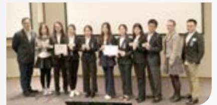
Time: 2019.1.21 Team: Two Wings BP: Gclean