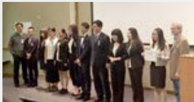
Time: 2016.8.8 Team: Orange BP: Medical big data