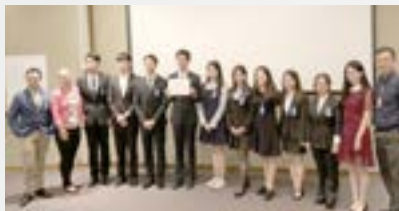
Time: 2018.8.26 Team: Freestyle BP: CC-Culture