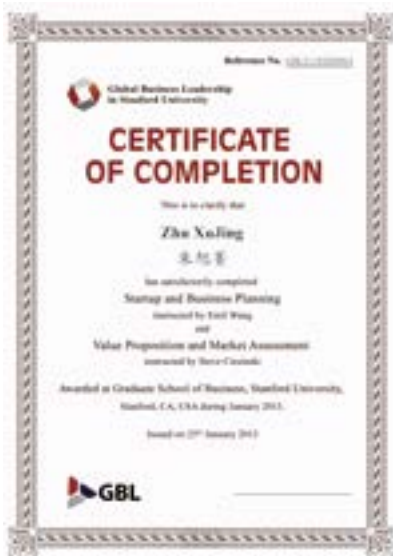
斯坦福大学学习证书