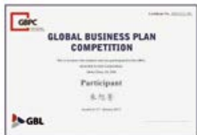
全球商业计划大赛参赛证书