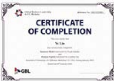
加州大学伯克利分校学习证书