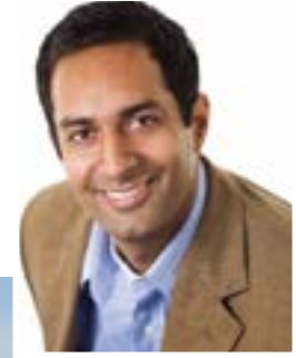
Professor of MS&E, Stanford University. Partner of Draper Fisher Jurvetson Venture Capital. Senior Consultant of McKinsey & Company.