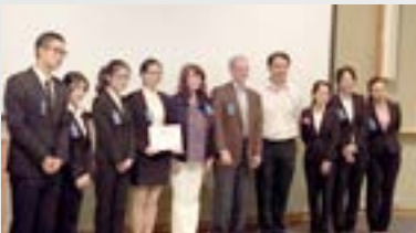
Time: 2015.8.2 Team: Six gold flowers BP: Old healthy care